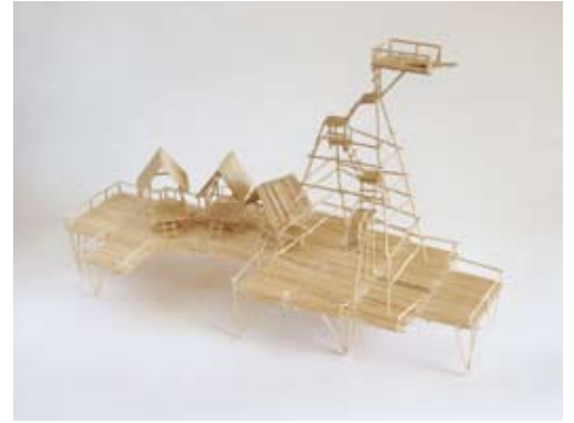
Pfahlbauerplattform 2006, Zahnstocher geleimt, 49 x 21 x 31 cm

2007, Zahnstocher geleimt, 28 x 26 x 19 cm