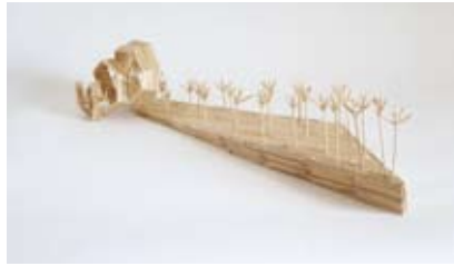
Das Feld von hinten aufrollen 2007, Zahnstocher geleimt, 48 x 19 x 11 cm