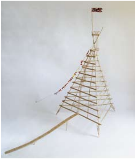
Shanty Tower 2006, Zahnstocher geleimt, 86 x 100 x 130 cm