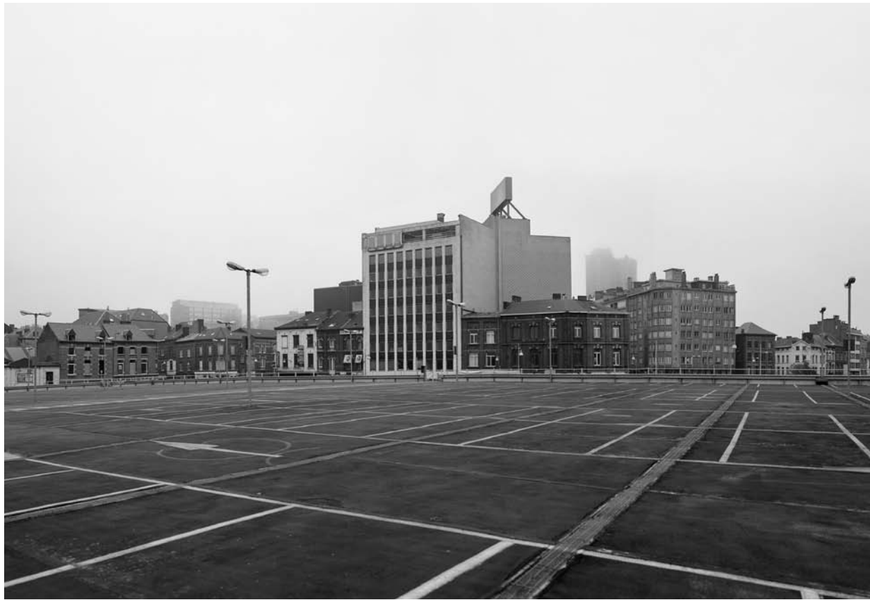
57 Place des Tramways