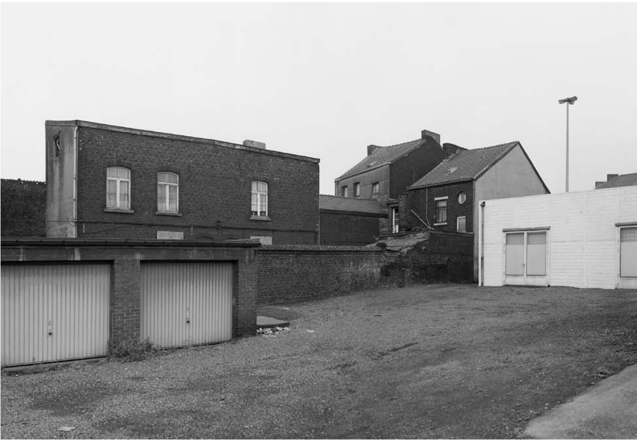
59 Chaussée de Mons