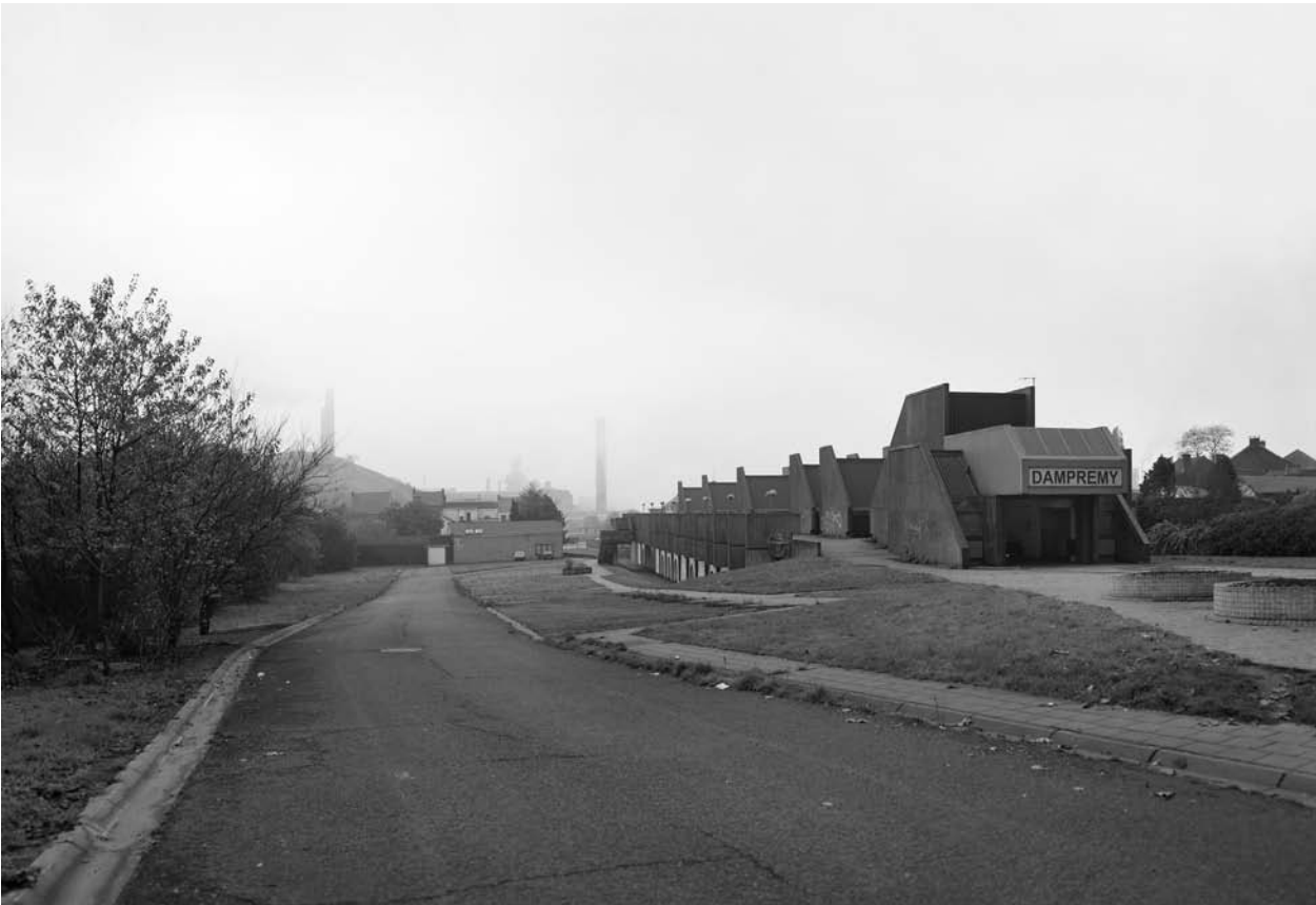
60 Metrostation Dampremy