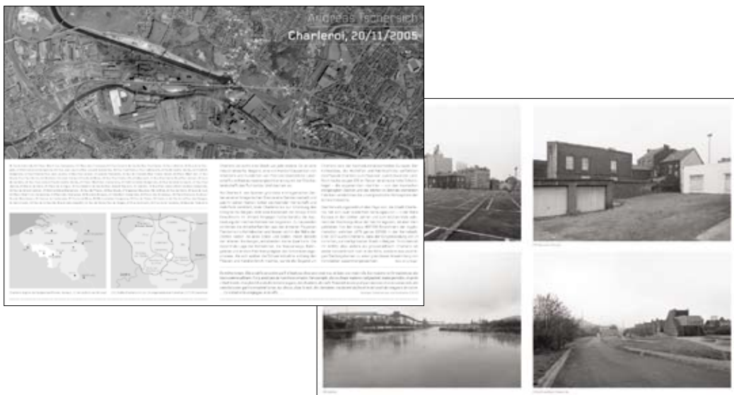
Infoblatt, recto/verso, gefaltet auf 17,5 x 25 cm

Die limitierte Künstleredition besteht aus einem Poster im Format 50 x 35 cm mit verschiedenen Schwarz-Weiss-Fotografien und einem Infoblatt, das geschichtliche und geografische bzw. regionale Informationen rund um die Stadt Charleroi und das nähere Umland liefert. Der Text wurde geschrieben von Hans Jörg Rieger, Kunsthistoriker in Zürich. Die Edition ist im Original beigelegt.