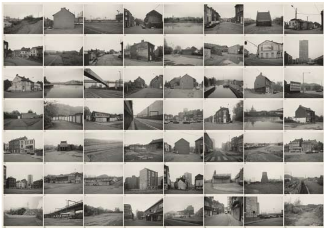
Poster auf Zeitungspapier, 35 x 50 cm

Die limitierte Künstleredition besteht aus einem Poster im Format 50 x 35 cm mit verschiedenen Schwarz-Weiss-Fotografien und einem Infoblatt, das geschichtliche und geografische bzw. regionale Informationen rund um die Stadt Charleroi und das nähere Umland liefert. Der Text wurde geschrieben von Hans Jörg Rieger, Kunsthistoriker in Zürich. Die Edition ist im Original beigelegt.