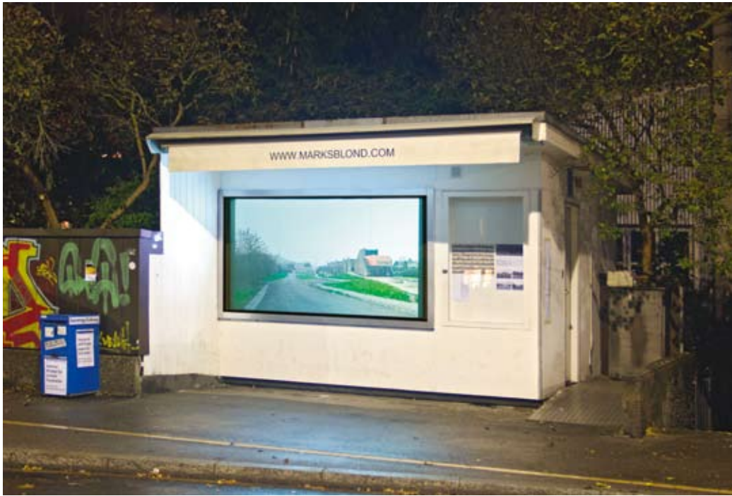
Metrostation Dampremy – Beamer-Projektion, 141 x 254 cm, farbig, 2005