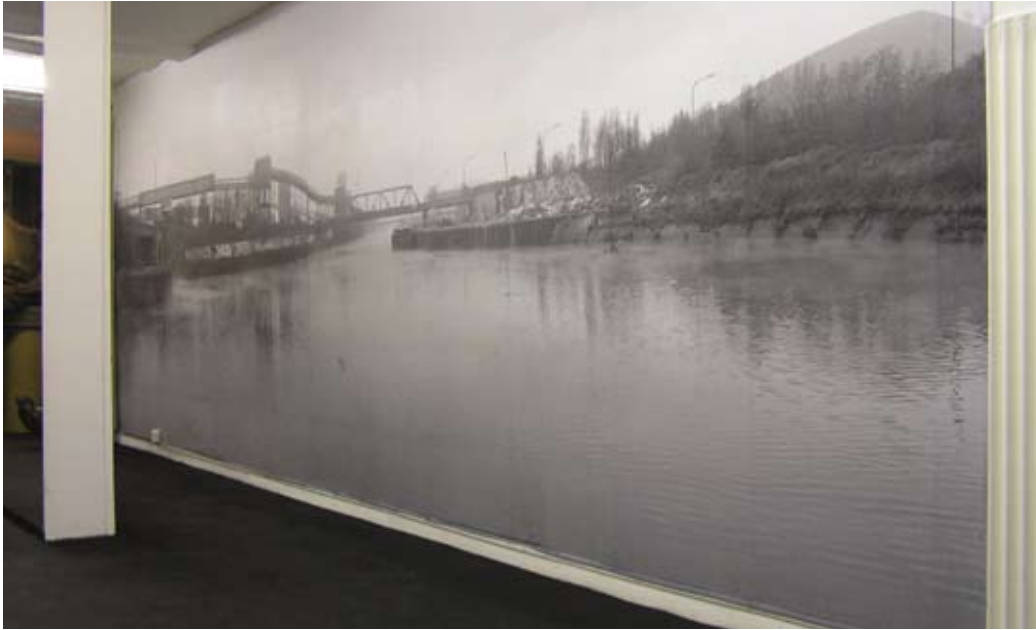
Sambre – Laserkopien, 205 x 488 cm, schwarz-weiss, 2005